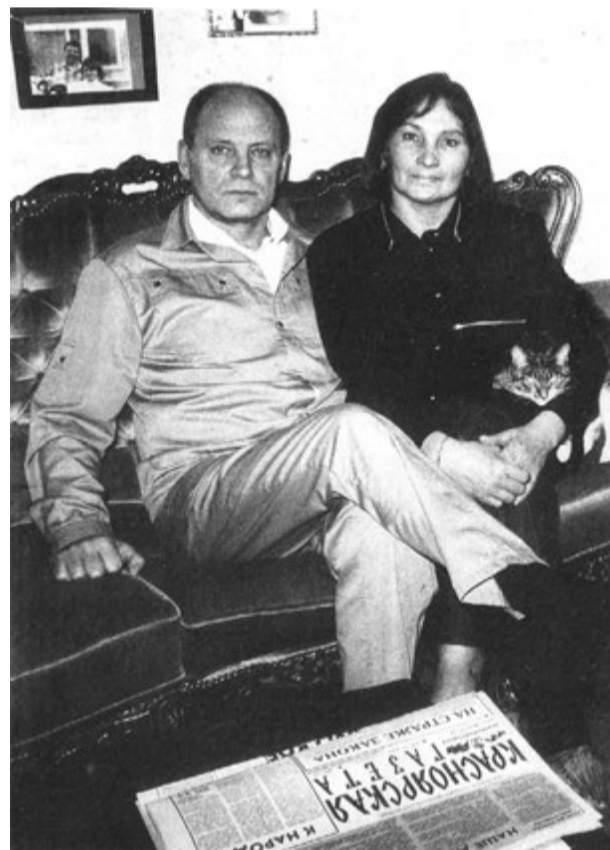
На следующий день после выхода из тюрьмы «Матросская тишина» (1 ноября 1992 г.)